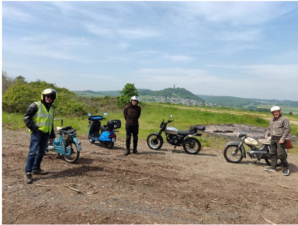
Osteifel-Tour für Mopeds 2023

Motorrad-Veteranen-Rallye in Euskirchen-Dom Esch