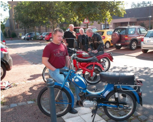
3PS-Tour Herbst 2015