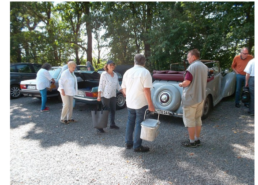
Picknicktour 2023 kurz vor der Mittagspause

Alles Weitere dazu steht noch nicht fest und wird spontan entschieden. Dazu bitte regelmäßig auf die Ankündigung auf unserer Homepage oder in unserer WhatsApp-Gruppe achten.