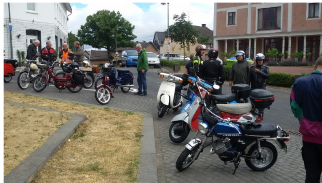
3-PS-Tour im Sommer 2017