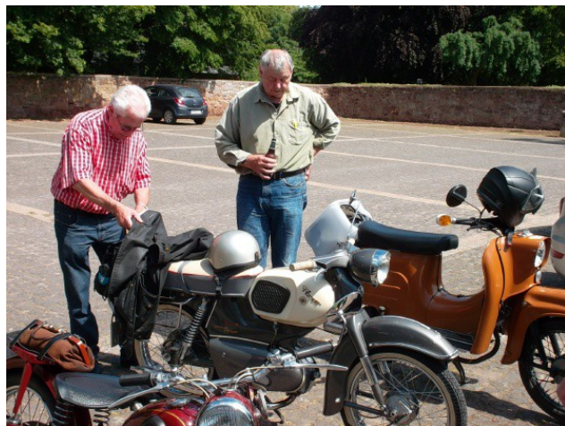
Heimbach-Tour im Sommer 2016