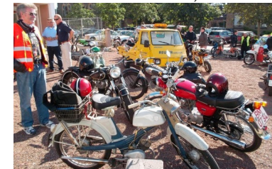
Spontane Zusatzangebote mitunter auf unserer Homepage